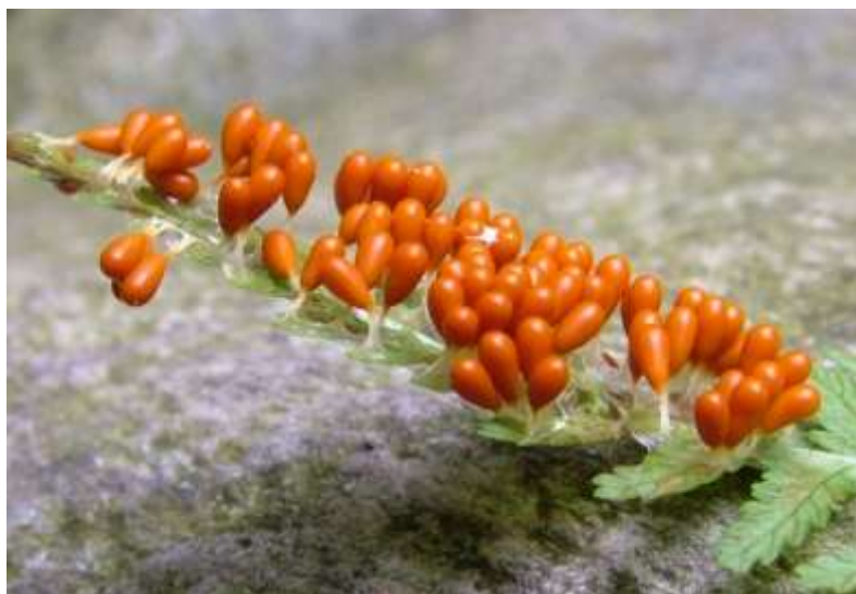
Gładysz kruchy Leocarpus fragilis (Dickson) Rost.