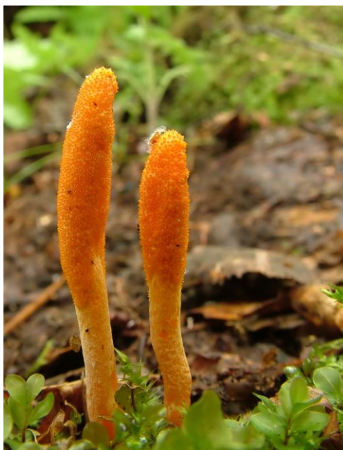
Maczuźnik bojowy ( Cordyceps militaris )

„Grzyby psychoaktywne występujące na obszarze Polski południowo-zachodniej.”