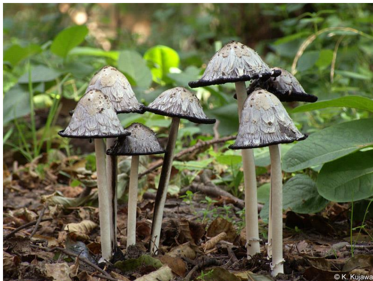
Czernidlak kołpakowaty ( Coprinus comatus )

„Micromycetes biebrzańskiego PN – wyniki sesji terenowych Polskiego Towarzystwa Mykologicznego.”